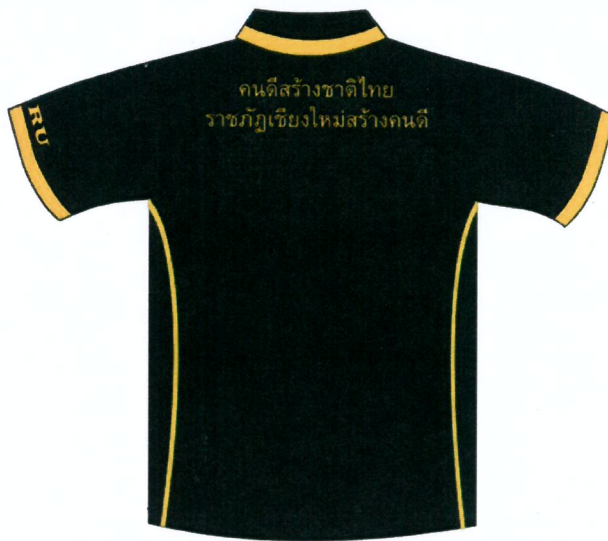
ด้านหลัง